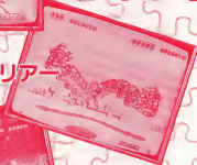
スーパー ハングオン