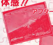
アフターバーナーII (2種)